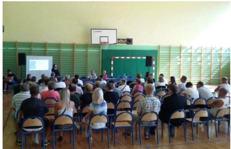
foto. spotkanie konsultacyjne w MSP nr 1 w sprawie rewitalizacji

W środę 31 sierpnia br. odbyło się kolejne spotkanie konsultacyjne z mieszkańcami w sprawie