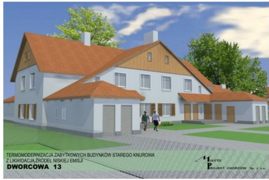
wizualizacja projektu termomodernizacji jednego z budynków III Kolonii