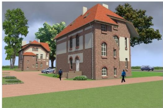
wizualizacja projektu termomodernizacji zespołu budynków przy ul. Dworcowej 29-33