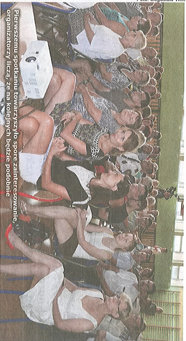
Pierwszemu spotkaniu towarzyszyło spore zainteresowanie. Organizatorzy liczą, że na kolejnych będzie podobnie

M iało być ożywić starą część Knurowa. Poprawić jakość życia mieszkańców, m. in. odnawiając budynki, drogi, infrastrukturę, ale też wzmocnić więzi społeczne, wspierać aktywność, wpływać na rozwój gospodarczy. Kierunki osiągnięcia celu ma wyznaczyć Lokalny Program Rewitalizacji - dokument niezbędny do pozyskania dofinansowania z UE.