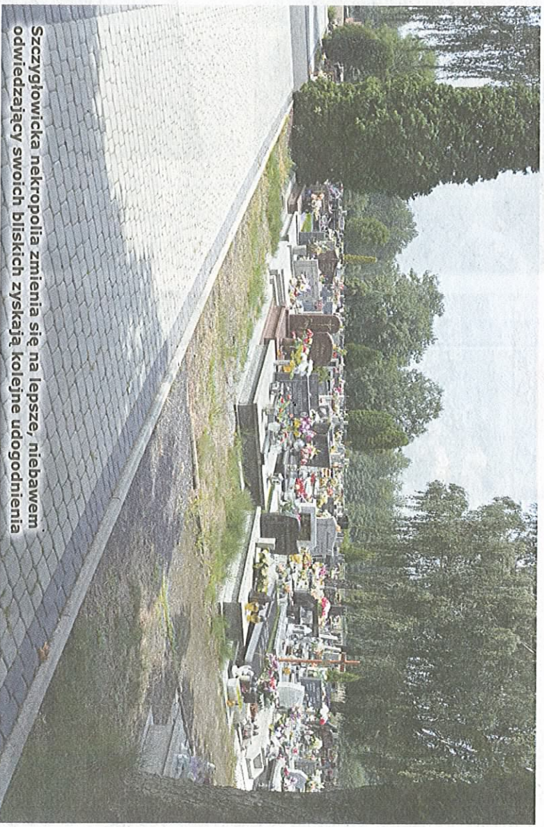
Szczygłowicka nekropolię zmienia się na lepsze, niebawem odwiedzający swoich bliskich zyskają kolejne udogodnienia