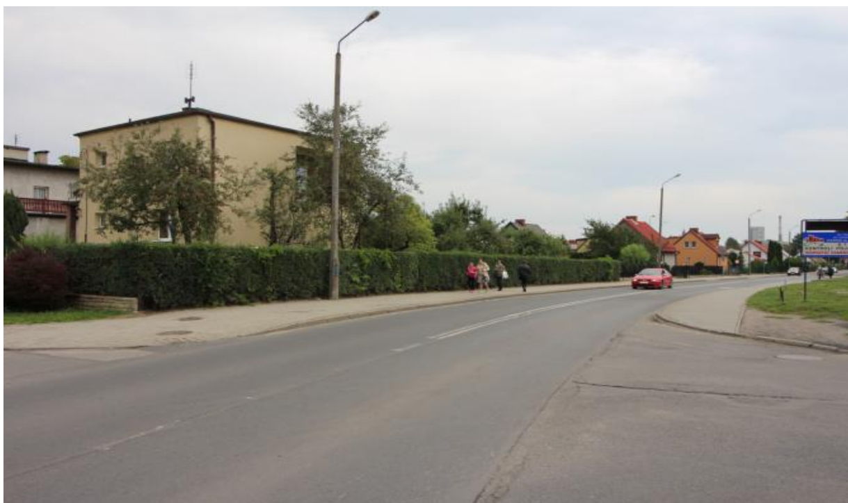
Fot. 1. Zabudowa mieszkaniowa w północnej części obszaru objętego projektem Planu. Widok od strony ul. Szpitalnej w kierunku południowo-wschodnim.