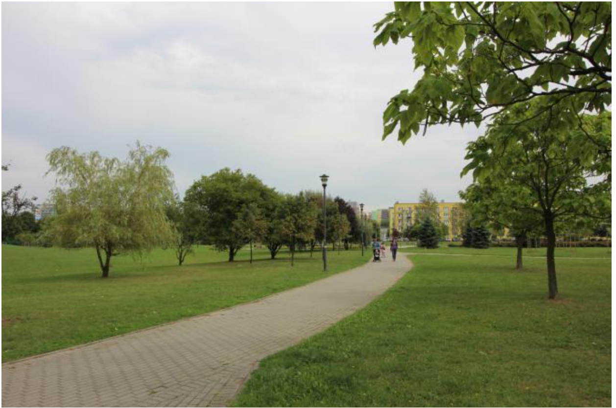
Fot. 3. Zieleń parkowa w rejonie Alei Lipowej.