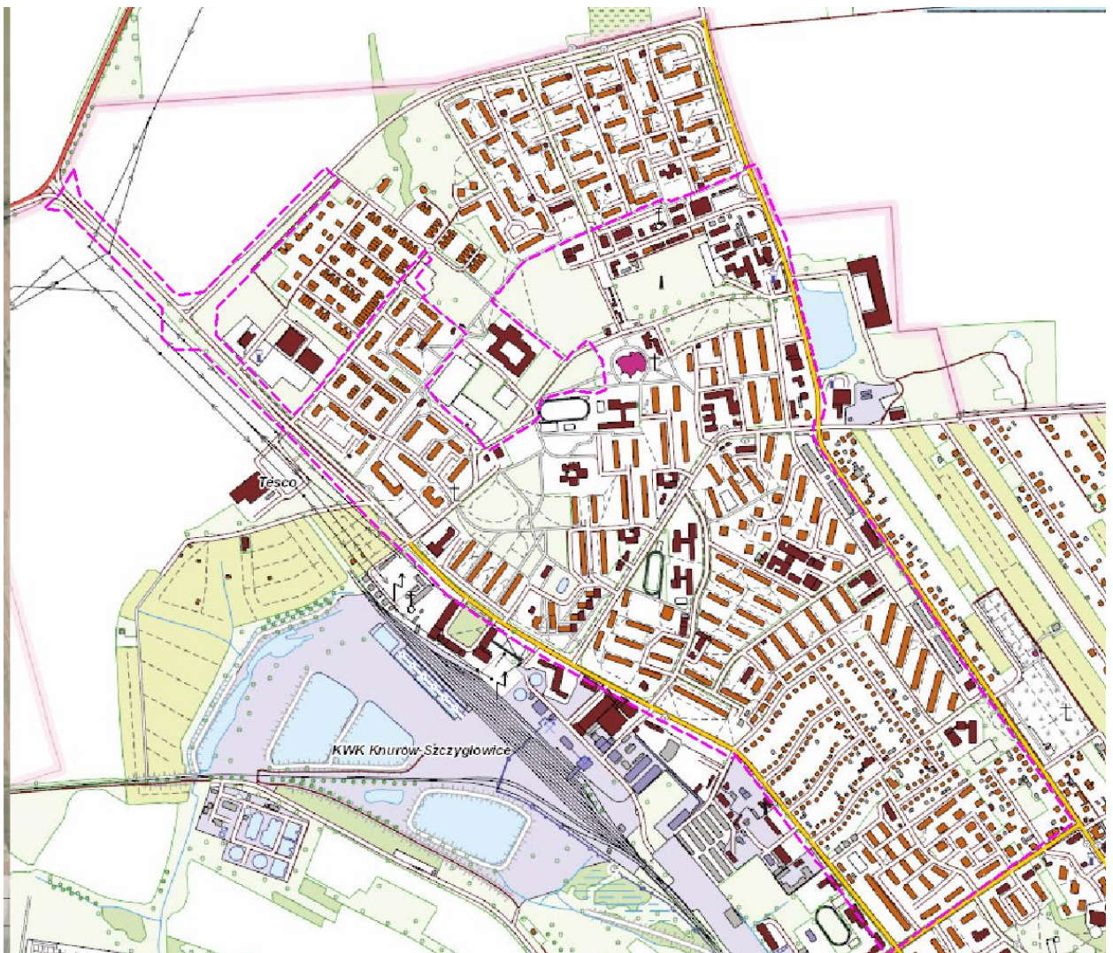
Rys. 1. Otoczenie obszaru objętego projektem MPZP na mapie topograficznej.

Rozwój zagospodarowania przestrzennego miasta Knurów związany jest z szeregiem uwarunkowań wynikających zarówno ze stanu istniejącego przedmiotowego terenu, polityki przestrzennej zawartej w studium uwarunkowań i kierunków zagospodarowania przestrzennego miasta jak również stanu i funkcjonowania poszczególnych elementów środowiska przyrodniczego. Przedmiotowy projekt planu obejmuje tereny położone pomiędzy ulicami Szpitalną, Wilsona, 1 Maja oraz północnymi granicami miasta.