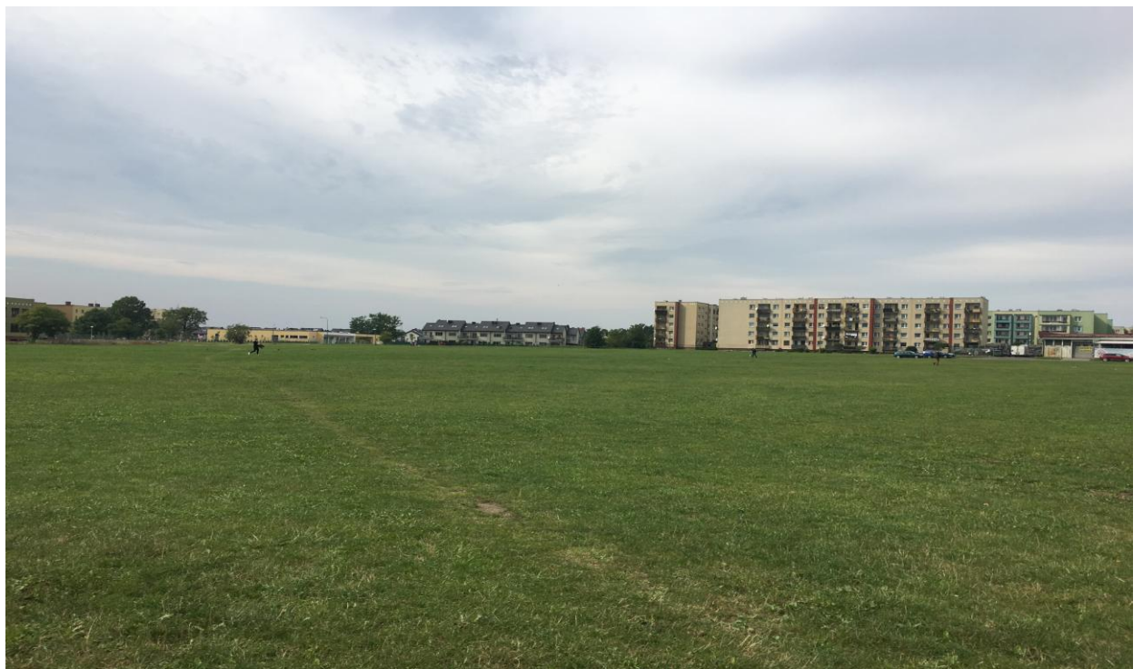
Fot. 4. Otwarte tereny zielone; widok w kierunku północnym od strony kościoła - w głębi zabudowa mieszkaniowa jednorodzinna i wielorodzinna.