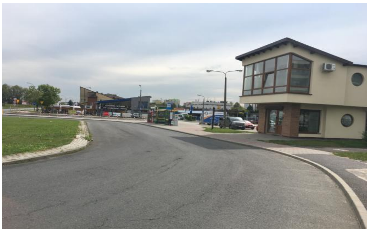
Fot. 2. Zabudowa usługowa w rejonie ul. 1 Maja.