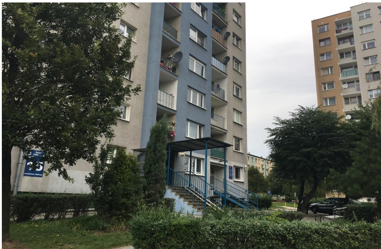
Fot. 6. Typowa zabudowa mieszkaniowa wielorodzinna przy ul. Kazimierza Wielkiego.