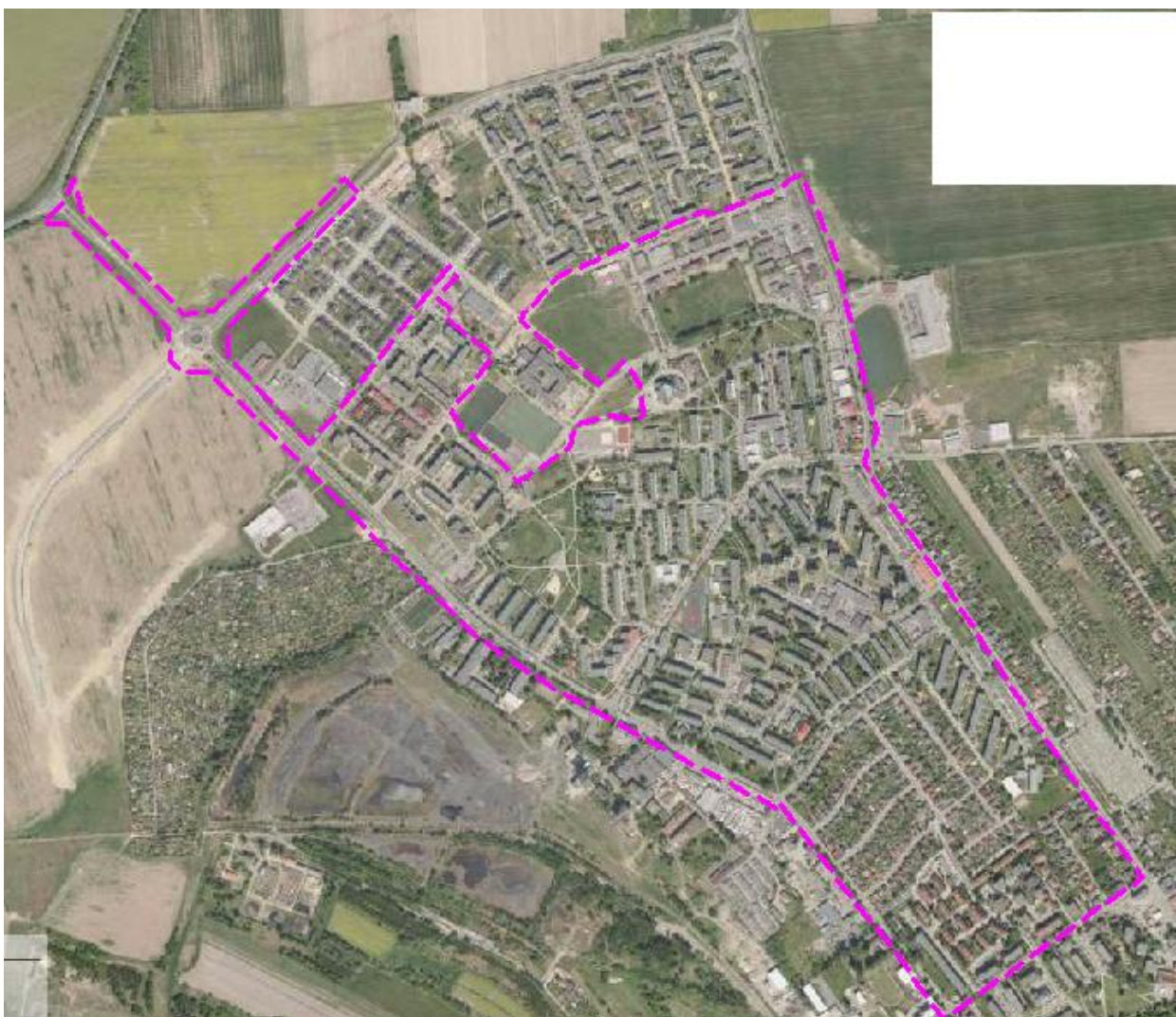
Rys. 2. Otoczenie obszaru objętego projektem MPZP na ortofotomapie.