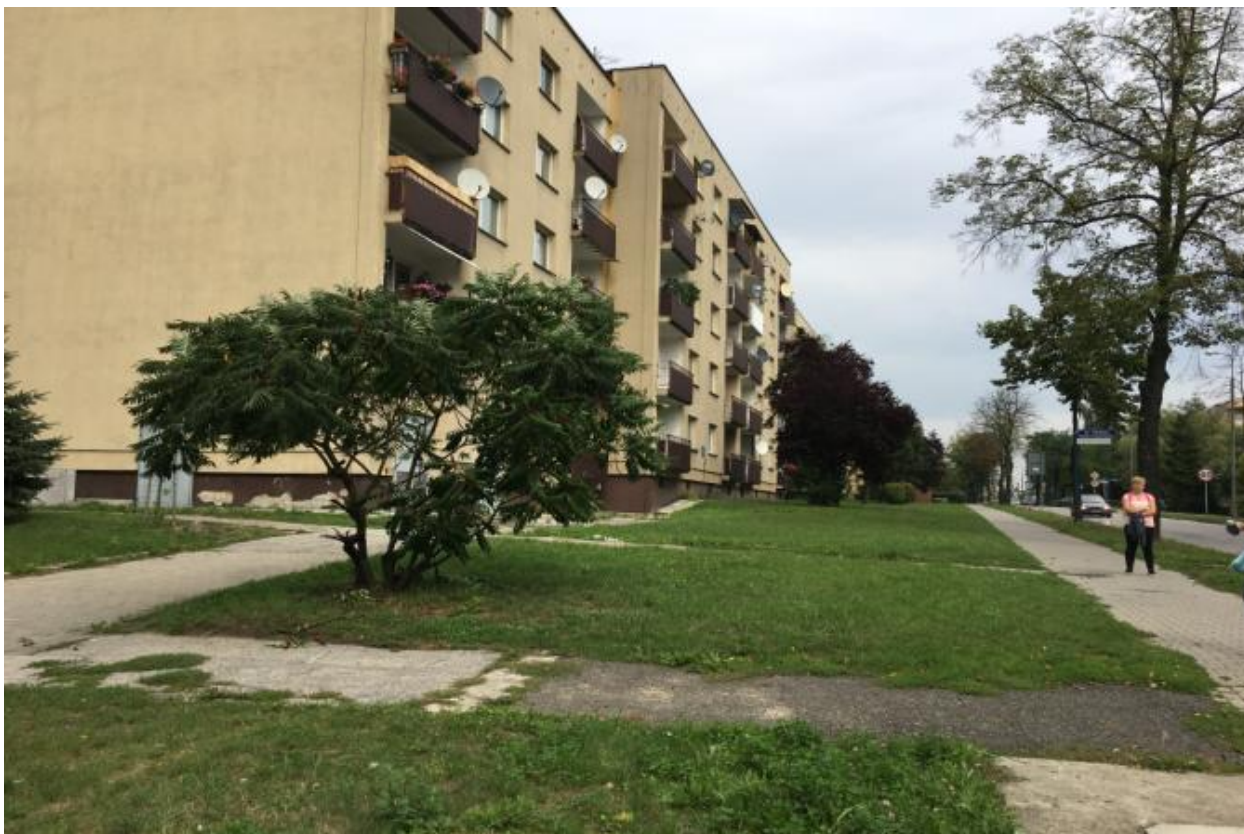
Fot. 5. Zabudowa mieszkaniowa wielorodzinna przy ul. Wilsona.