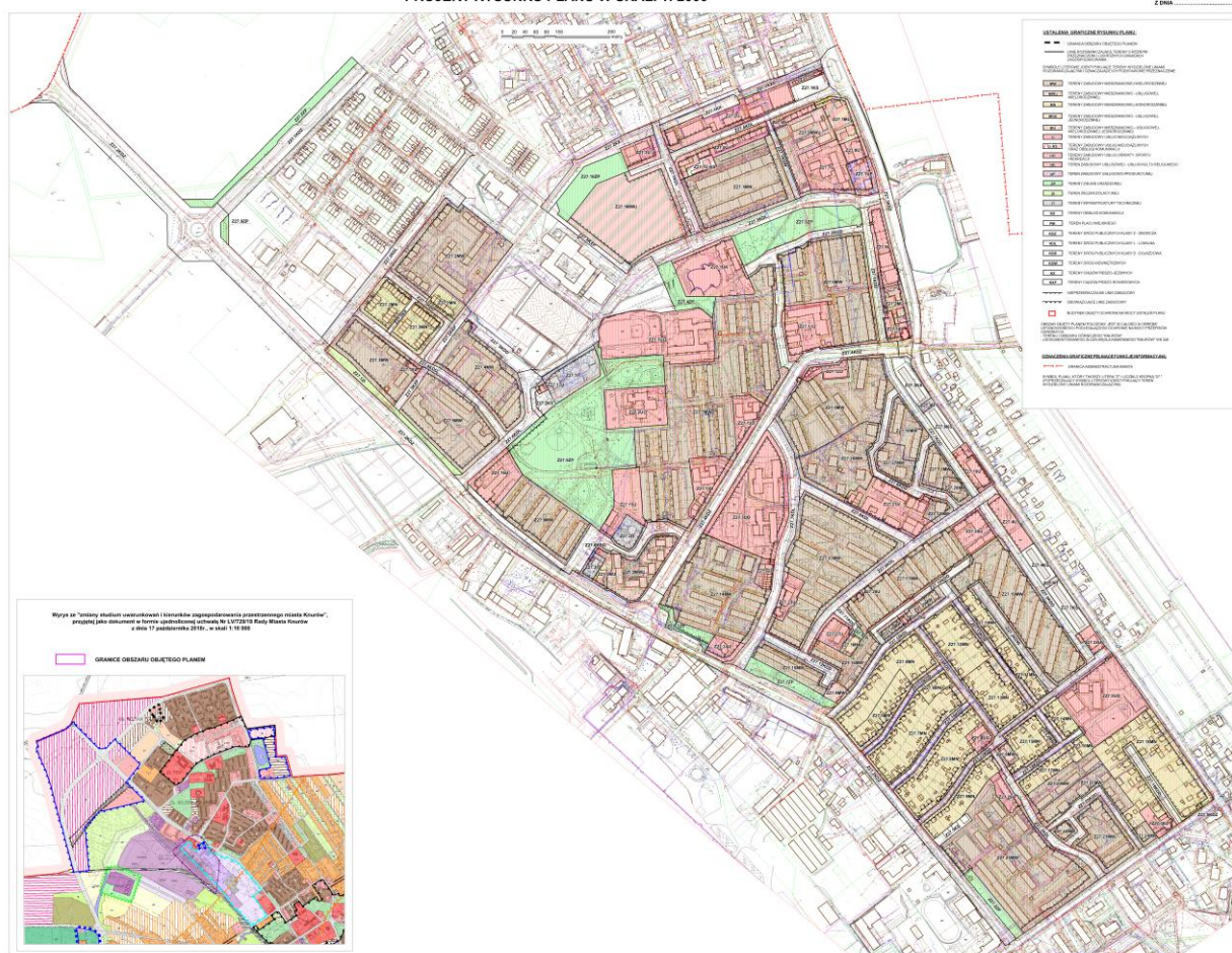
Rys. 3. Rysunek projektowanego planu zagospodarowania przestrzennego.

ZALĄCZNIK NR 1 DO UCHWAŁY NR RADY MIASTA KNURÓW Z DNIA